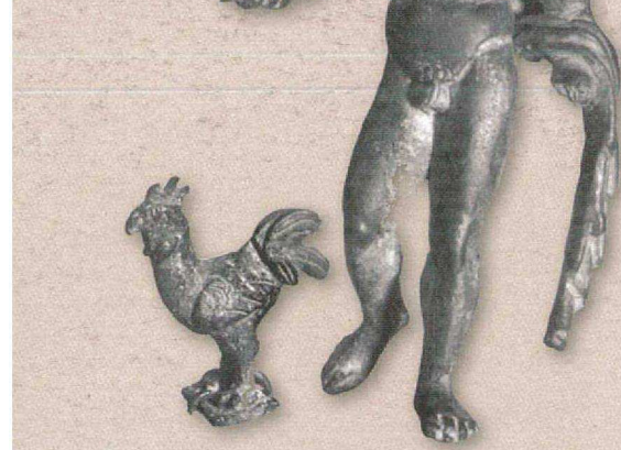
Statuette de Mercure, recueillie à côté de celle d'un coq, attribut de ce dieu sur les autels domestiques. Visible au Musée du Château d'Annecy

à coloniser la région et une coexistence pacifique prendra le pas sur une soumission par la contrainte.